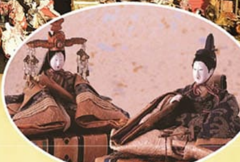
特別展示:「平戸松浦家のひな人形」

お雛様変身、及び赤毛のアン変身コーナーについては、コロナウイルス感染拡大防止の観点から本年度は中止いたします。ご了承ください。